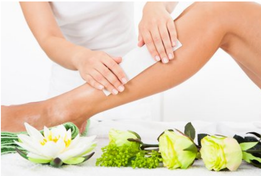
Foto: Enthaarung durch Waxing